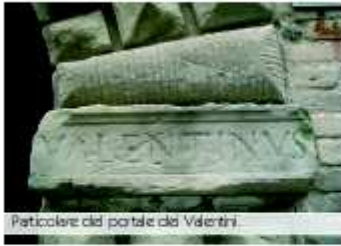
Particolare del portale di Valentini.

dimostrano gli architravi in arenaria che abbracciano le finestre delle strutture ed il bel portale.