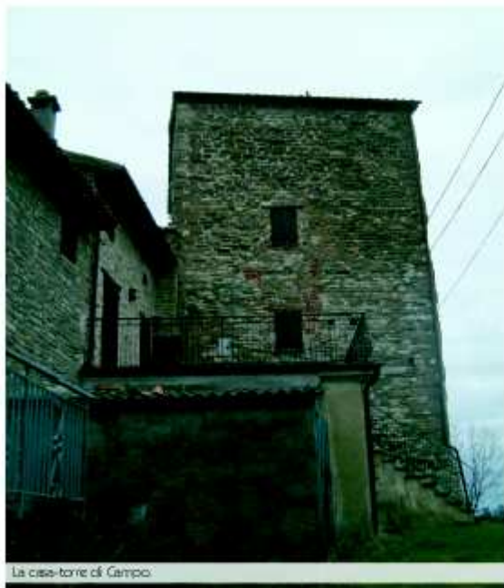
La casse-torre di Campo.

Un dantesco vortice di pietra dal quale affiorano, di tanto in tanto, dei visi, tristi, sofferenti e bestie immaginarie. Un viso, in particolare,