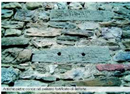
Antiche pietre concise nel palazzo fortificato di Belforte.

Ma resta un mistero: l'albero genealogico del Barone non fu letto da nessuno. Si dice che giunse in Italia , ma qualcuno lo nascose, per omettere scomode notizie e le maledingue, forse a ragione, insinuano che nel Barone , malgrado tutto il suo amore e la sua buona volontà, non scorresse proprio sangue italiano, anzi, feretrano!