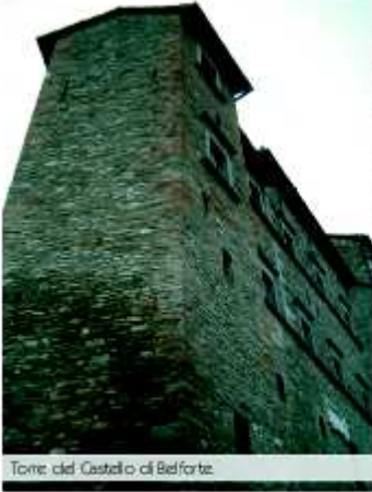
Torre del Castello di Belforte.

Il comune cerca di sopravvivere grazie alle imprese sorte nelle vicinanze, che danno comunque lavoro a gran parte della popolazione ed è in cerca di un moderno senso, che lo caratterizzi nel terzo millennio.