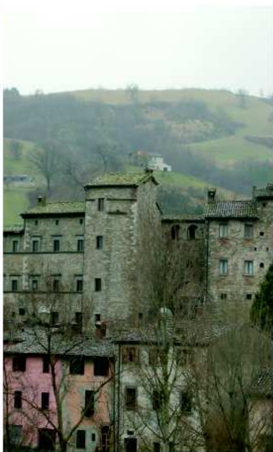
Veduta del Palazzo Fortificato di Belforte.