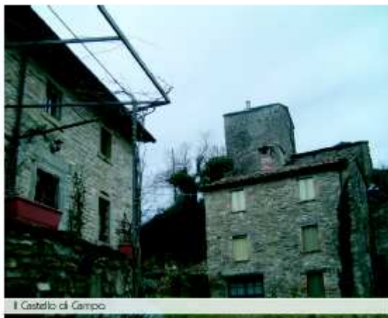
Il Castello di Campo

In questo lembo di Montefeltro , proprio tra Belforte e Monteone sono stati effettuati diversi ritrovamenti archeologici di epoca romana a testimonianza che, anche tra queste montagne, giunse l'opera ordinatrice della cultura romana.