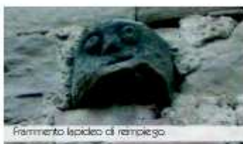
Frammento lapideo di riempimento.

Girovagando attorno il piccolo podio che sostiene le abitazioni, si notano resti di questa cinta muraria fortemente lesionata e mancante nella maggior parte del suo perimetro. Seguendo ciò che resta delle mura si arriva ad una chiesa. La sua facciata è scarna, grigia. Parrebbe, a prima vista, una chiesa come tante, senza particolari elementi di pregio. Accostandosi invece alla muratura di destra è possibile notare, nella trama del paramento, alcune particolari pietre. Certe, perfettamente riquadrate, in arenaria, mostrano ancora i segni della loro lavorazione,