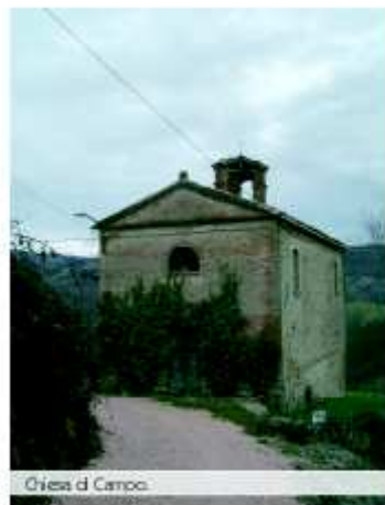
Chiesa di Campo.

Giunti al limite dell'abitato compare una piccola chiesetta con, disesa innanzi, una macina in pietra. La struttura è moderna e non deve