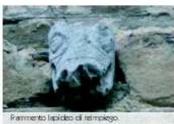
Frammento lapideo di riempimento.