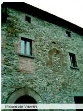
I Palazzi dei Valentini

Appena fuori del castello, nel borgo, si trovano le abitazioni cinquecentesche dei Valentini , ricchi proprietari terrieri, che si affacciano su un caratteristico vicolo. Si tratta di palazzi dall'aspetto sobrio, ma al contempo ricercato come