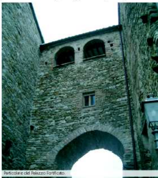
Particolare del Palazzo Fortificato.

L'antico castello sorge su un'ansa del fiume Foglia naturalmente difeso dal corso d'acqua, a poca distanza dalla pieve di San Lorenzo in Foglia. Questa chiesa si trovava dove oggi sorge il cimitero cittadino ed aveva un territorio di pertinenza (piviere) piuttosto esteso. Per la sua vicinanza con Sestino che, anticamente, era municipium romano, nelle campagne di Belforte si rinvengono, oggi, diversi reperti d'epoca romana di