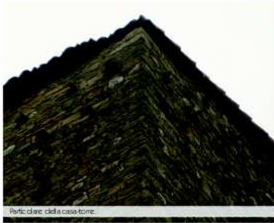
Particolaro della casa-torre.

Stupisce la struttura, slanciata e compatta, composta da continui corsi di pietre regolari, sovrapposti, come a formare la trama di un tessuto. Osservare la casa è vedere attraverso un foglio di carta pergamena, controluce; tutto è ad incastro, ad iniziare dai suoi cantonali, massicci, sempre in arenaria. L'edificio conserva le sue originali feritoie. Uno spicchio di Medioevo perso verso le estreme propaggini della provincia, in un territorio formidabile: il Montefidato .